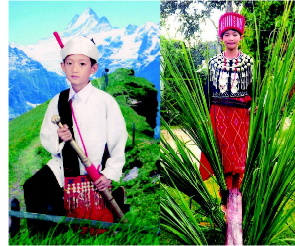
Shingra Wa Zau Kying hte Baren shayi Nang Pyi

Shingra wa Zau Kying hte baren shayi Nang Pyi dingku de ai shani kaw nna mayu baren wa sharung jaw dat ai. La ni a bungkhaw gaw matu hkyeng ai mayu wa dama masat ai re. Shayi sha ni lang ai Gumhpraw palawng gaw, baren sep maka hpe yu nna galaw ai re. Dai shani kaw nna, baren shayi Nang Pyi hpe kumba shalai la ai. Kumba kaw shalai ai gaw baren lapu sama n manam na matu shalai ai re. Dai ni du hkra Zaiwa myu sha ni Kumba hpe manu shadan nna lang hkrat wa ai awu asin re ai hpe kumba matut nna La ni hpe gaw kru lang, Num ni hpe sanit lang Dumsa wa kumba hpe lang nna, shawan jasan ga tsun ai re. Kumba lang sharawt jahkrat dat nhtawm shingkawt shangun ai re. Ndai zawn Zaiwa myu sha ni kumba hpe Num hkungran ai kaw lang hkrat wa ai re. Myu shayi sha ni lang ai da maka labu hkawhtawn laraw ni gaw (nhik lum chyun hui mau) (shing nrai) Majoi shingra, Mau ngoñ chyingdám lam, Nyi ngoñ tsanoq long Daquzing ma[ Yang chyin byaw wang mau, Hpaw goi zing mo lhogyuñg dong dong mau yuqzo byahg hîng wuh, pyí zo wan htang lhîng, kaw nna lang hkrat wa ai re.