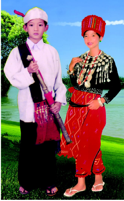
Shingra Wa Zau Li hte Mu shayi Nang Yi

Shingra wa Zau Li gaw grai matsan ai majaw hka shi kaw tingraw ja sha ai. Jahpawt shagu tingraw sa yu yang lung din sha rawng nga nga re ai. Dai lung din hpe gaw jahpawt shagu gabai kau timung bai wa rawng nga ai. Dai majaw nta de la wa nna, sumpu kaw wa bang da nu ai. Dai shani kaw nna, shana shagu shan woi dwi sha na matu lusha shadu tawn tawn re ai. Dai majaw lani mi na nhtoi hta shan woi dwi gaw wa lagu yu yang, tsawm dik ai Num kasha langai mi lusha shadu nga ai hpe wa mu ai. Shaloi shan woi dwi a sharat na jang, shan woi dwi a sumpu kaw gat shang mat ai.